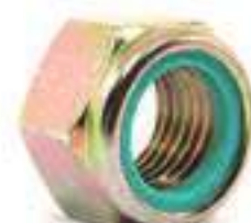
Porca Suporte Barra Tração

Código Original: R113894 Código Diversa: 1012838