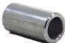
Bucha Aço Eixo Pedal Embreagem

Código Original: C5NN3110A Código Diversa: 1001312