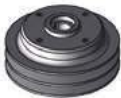
Polia Bomba D'água Motor Perkins