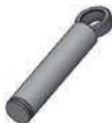
Haste Cilindro Hidráulico Auxiliar Comp. Haste: 312,00mm

Código Original: 83435900 Código Diversa: 1010785