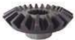
Engrenagem Planetária Diferencial Dianteiro 21 Dentes 16 Estrias

Código Original: 81728114 Código Diversa: 1013043