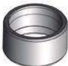
Pista Retentor Traseiro