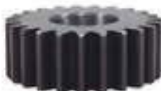
Engrenagem Satélite Eixo Dianteiro 23 Dentes

Código Original: 5103870 Código Diversa: 1010467