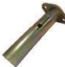
Pino Dianteiro Eixo Tração

Código Original: 84193585 Código Diversa: 1013589