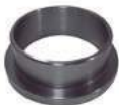
Bucha Tração ZF

Código Original: 1668542M91 Código Diversa: 1011267