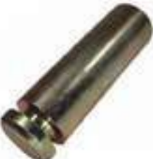
Pino Suporte Barra Tração

Código Original: C7NN807C Código Diversa: 1004977