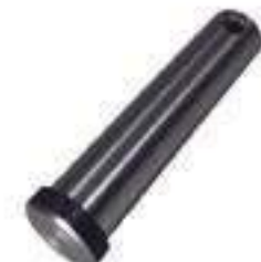
Pino Braço Hidráulico

Código Original: 5108775 Código Diversa: 1010844