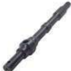
Eixo Sensor Hidráulico

Código Original: R108085 Código Diversa: 1012578