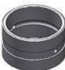
Bucha Aço Eixo Inferior Sistema Hidráulico