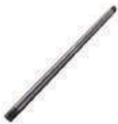
Barra Estabilizadora Braço Hidráulico

Código Original: D2NN805A Código Diversa: 1001539