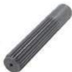
Ponteira Estriada Salva Eixo 21 Estrias

Código Original: 3800250/P Código Diversa: 1011841