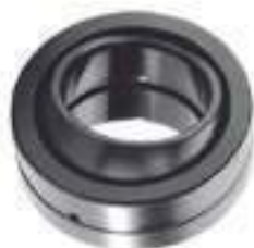
Rótula GE 35 DO Diâmetro Int.: 35,00mm