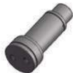
Pino Articulação Comprimento: 141,70mm

Código Original: 20415802 Código Diversa: 1008220