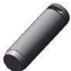
Pino Comprimento: 200,00mm Cód. Alt.: JCB3730

Código Original: 771610 Código Diversa: 1008169