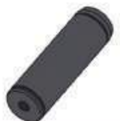
Pino Comprimento: 112,00mm Cód. Alt.: 20415307

Código Original: 773770 Código Diversa: 1008172