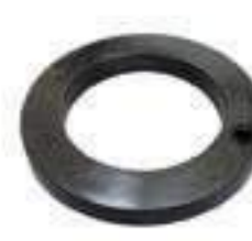
Anel Suporte Eixo Dianteiro Espessura: 08mm

Aplicação: New Holland TM 130 New Holland TM 140