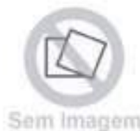
Porca Roda Traseira Cônica 3/4" - 16UNF

Código Original: 4391483 Código Diversa: 1013720