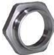
Porca Pinhão Eixo Traseiro

Código Original: 14M7298 Código Diversa: 1012847