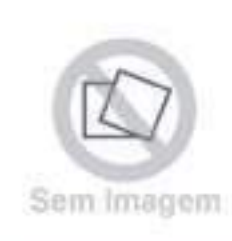
Braço Levante Hidráulico

Código Original: 5158928 Código Diversa: 1003837