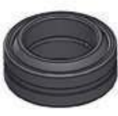
Rótula GE 40 DO Diâmetro Int.: 40,00mm