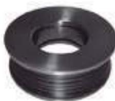
Polia Tensor de Corria Freio Pneumático

Código Original: E6NN8A618AA Código Diversa: 1010232