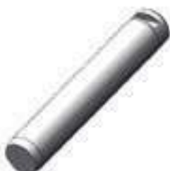
Pino Comprimento: 255,00mm

Código Original: 20410604 Código Diversa: 1004571