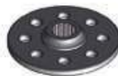
Flange 8 Furos 15 Estrias

Código Original: 82422200 Código Diversa: 1012181