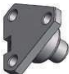
Pino Ponta de Eixo Eixo Dianteiro