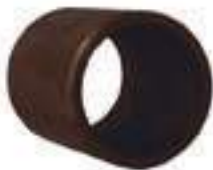
Bucha Bronze Palanca de Marchas

Código Original: 83953543 Código Diversa: 1012265