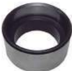
Espaçador Barra Estabilizadora Espessura: 28,50mm

Código Original: F0NN6B306AA Código Diversa: 1004965