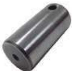
Eixo Engrenagem Tração Dianteira Comprimento: 70,00mm

Código Original: 83062210 Código Diversa: 1011123