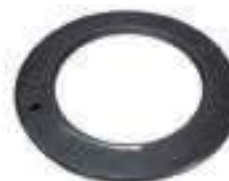
Anel Eixo Dianteiro

Aplicação: New Holland TM 130 New Holland TM 140