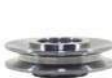
Polia Tensor de Corria Bomba D'água

Código Original: 81871906 Código Diversa: 1010860