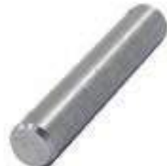
Pino Braço Levante

Código Original: 5103861 Código Diversa: 1011637