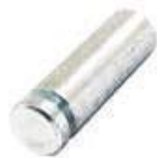
Pino Suporte Barra Tração

Código Original: C7NN4048D Código Diversa: 1000292