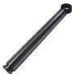
Haste Cilindro Hidráulico Auxiliar

Aplicação: Ford 7630 Ford 7830 Ford 8030