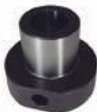
Bucha Aço Excêntrica Caixa de Câmbio

Código Original: 82002586 Código Diversa: 1010679