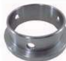
Bucha Tração ZF

Código Original: 3588080M1 Código Diversa: 1001603