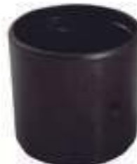
Bucha Pino Central Eixo Dianteiro

Código Original: L79610 Código Diversa: 1011617