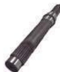
Eixo Tomada de Potência

Código Original: CQ29405 Código Diversa: 1001195