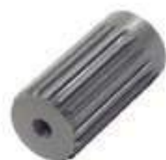
Ponteira Estriada Salva Eixo Pinhão Tração Carraro 20 Estrias

Código Original: 068552 Código Diversa: 1013717