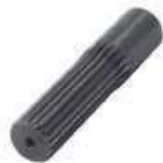
Ponteira Estriada Salva Eixo 20 Estrias

Código Original: 909106/P Código Diversa: 5008119