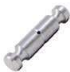
Pino Cilindro Direção

Código Original: 898363M1 Código Diversa: 1001032