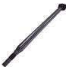
Haste Cilindro de Direção

Código Original: 83993398 Código Diversa: 1011414