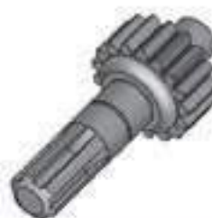
Eixo Acionamento Tração ZF 06 Estrias 21 Dentes

Código Original: 3603220M1 Código Diversa: 1003858