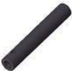
Pino Suspensão Dianteira

Código Original: 1864869M1 Código Diversa: 1001555