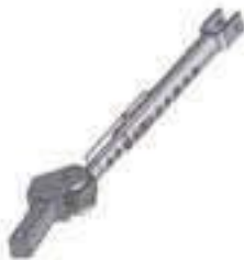
Estabilizador Lado Esquerdo

Código Original: 82422300 Código Diversa: 1011151