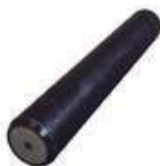
Pino Central Eixo Dianteiro

Código Original: 898643M1 Código Diversa: 1004251