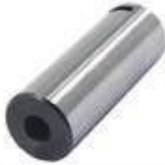
Pino Engrenagem Eixo Traseiro

Código Original: 5168833 Código Diversa: 1010502