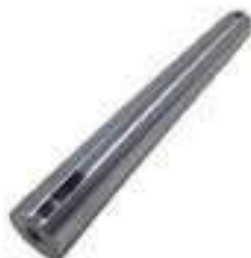
Eixo Palanca de Marchas Caixa Lateral Comprimento: 188,00mm

Aplicação: New Holland TM 150 New Holland TM 165 New Holland TM 180