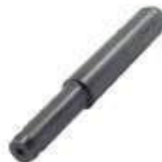
Pino Braço Hidráulico

Código Original: 82824691 Código Diversa: 1013179