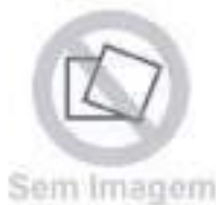
Eixo Solar Tração ZF

Código Original: L116104 Código Diversa: 1013606