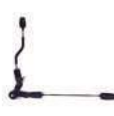
Kit Acionamento Embreagem

Código Original: 5166146 Código Diversa: 1011065