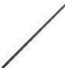
Árvore Transmissão Comprimento: 1762,00mm 12 / 14 Estrias

Código Original: D2NN7017A Código Diversa: 1003826