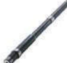
Árvore Eixo Tomada de Força Caixa de Câmbio 21 / 25 Estrias Comprimento: 690,00mm

Código Original: 4997510 Código Diversa: 1010533