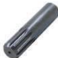
Ponteira Estriada (Salva Eixo) Tomada de Potência 10 Estrias