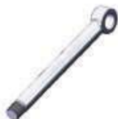
Haste Cilindro Hidráulico Auxiliar Comp. Haste: 282,00mm

Código Original: 836764239 Código Diversa: 1012780