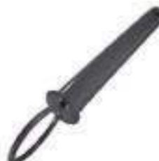
Pino Barra Tração Comprimento: 200mm Espessura: 25,40mm

Código Original: 3146131M1 Código Diversa: 1010242