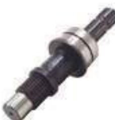
Eixo Tomada de Potência (TDP) Comprimento: 289,00mm 28 / 06 Estrias

Aplicação: Ford 5630 / 6630 / 7630 Ford 7830 / 8030 New Holland TS 100