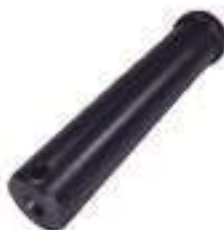
Pino Braço Hidráulico