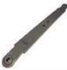
Braço Levante Hidráulico

Código Original: 5171674 Código Diversa: 1008191