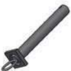
Pino Barra Tração Comprimento: 220mm Espessura: 28,57mm

Código Original: 3146131M1 Código Diversa: 1001143