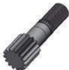
Eixo Solar Tração Dianteira

Código Original: R182321 Código Diversa: 1012579