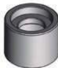
Guia Ventilador Polia Bomba Dágua Cód. Alt.: 82685400

Código Original: 30321000 Código Diversa: 1011107