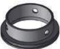
Bucha Tração ZF APL 350

Código Original: 3598999M1 Código Diversa: 1011866