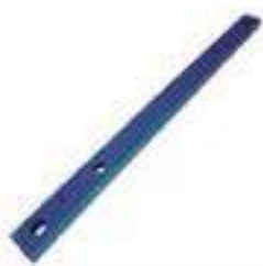
Barra Tração Com Tratamento Térmico

Código Original: C5NN805J Código Diversa: 1001538