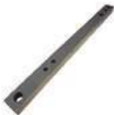
Barra Tração Com Tratamento Térmico

Código Original: 5128655 Código Diversa: 1006002