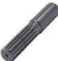
Ponteira Estriada Salva Eixo Transmissão 14 Estrias

Código Original: 83995241 Código Diversa: 1005309