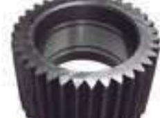
Engrenagem Satélite Pinhão Eixo Traseiro Redução Final 35 Dentes

Código Original: R113899 Código Diversa: 1013381