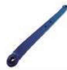
Braço Levante Hidráulico

Código Original: D6NN555A Código Diversa: 1001586