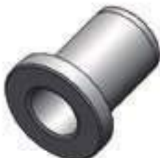
Bucha Centralizadora Tração Carraro

Código Original: 041081R1 Código Diversa: 1005401