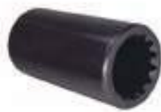
Luva Eixo Dianteiro 14 Estrias

Código Original: 4994076 Código Diversa: 1008133