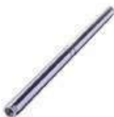
Haste Cilindro de Direção Tração ZF APL 350

Código Original: E3NN3A540 Código Diversa: 1004493