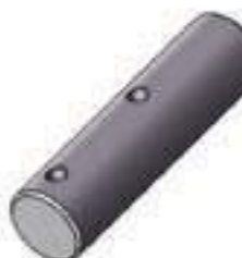
Pino Planetária Redução Final

Código Original: L102665 Código Diversa: 1005889