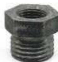
Adaptador Gaxeira 1/8 Pino Cilindro de Direção

Aplicação: New Holland TL 90/100 New Holland TM 110/120