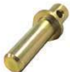
Pino Central da Balança Eixo Dianteiro V Inferior

Código Original: E4NN312AA Código Diversa: 1003513