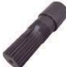
Ponteira Estriada Salva Eixo Pinhão Tração 22 Estrias

Código Original: Código Diversa: 1008394