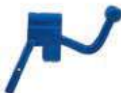
Alavanca Braço Nivelador

Código Original: Código Diversa: 1007290