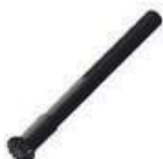
Eixo Lado Direito / Curto Comprimento: 548mm 28 Estrias

Código Original: 30057800 Código Diversa: 1013737