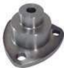
Eixo Manga Comprimento: 69,50mm

Código Original: Código Diversa: 1008425