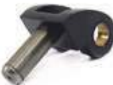
Pivo Palanca de Marchas

Código Original: EONN541AA Código Diversa: 1003759