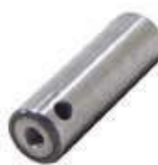
Pino Engrenagem Planetária Eixo Traseiro

Código Original: 1482939M91 Código Diversa: 1003666