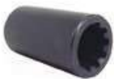
Luva Arraste 10 Estrias

Código Original: Código Diversa: 1012387