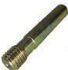
Pino Cilindro Direção

Código Original: 042735P1 Código Diversa: 1012435