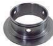
Bucha Aço Tração ZF Com Rasgo

Código Original: 83985059 Código Diversa: 1012269