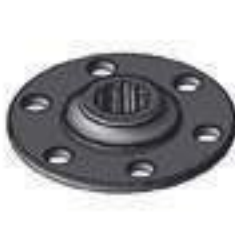
Flange Cubo Tomada de Potência 10 Estrias

Código Original: 82992059 Código Diversa: 1008282