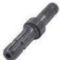
Eixo Tomada de Potência Cód. Alternativo: L173282

Código Original: L76496 Código Diversa: 1010575