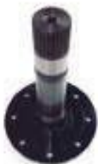
Ponta de Eixo

Código Original: 836764242 Código Diversa: 1012779