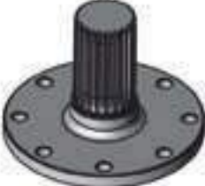
Semi Árvore Freno Em Cima Comprimento: 179,20mm 22 Estrias

Aplicação: Massey Ferguson MF 283 Massey Ferguson 750