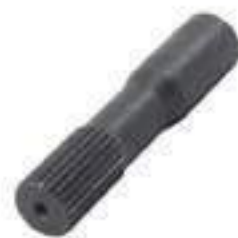
Ponteira Estriada Salva Eixo Eixo Tração ZF 24 Estrias Comprimento: 150mm

Código Original: 3409609/P Código Diversa: 1001367