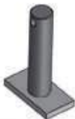
Pino Fixador Braço Regulador Hidráulico

Código Original: L77493 Código Diversa: 1010795