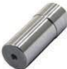
Pino Tração Dianteira

Código Original: 4997509 Código Diversa: 1008350