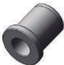
Bucha Tração Carraro