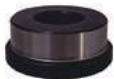
Bucha Aço Volante

Código Original: CFPN4013A Código Diversa: 1000293