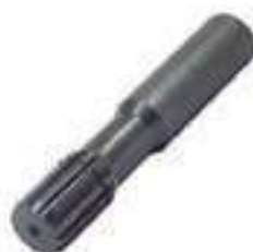
Ponteira Estriada Salva Eixo Transmissão 12 Estrias

Código Original: 5168037/P Código Diversa: 1008164