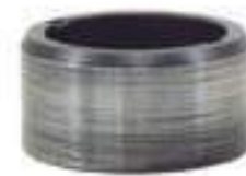
Colar Eixo Caixa de Transferência

Código Original: 023089N1 Código Diversa: 1004596