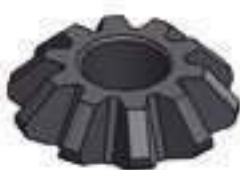
Engrenagem Satélite Diferencial Traseiro Redução 10 Dentes

Código Original: R937883 Código Diversa: 1013076