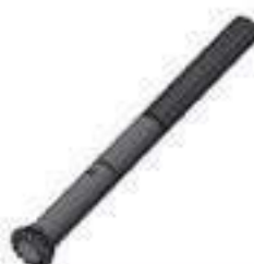
Eixo Regulagem Hidráulico 15 Dentes