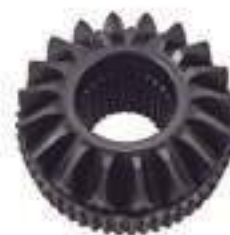
Coroa Engrenagem Transmissão Diferencial

Código Original: AL152415 Código Diversa: 1012030