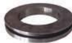
Emboło Setor de Direção

Código Original: 82020754 Código Diversa: 1010423