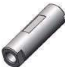
Pino Fixador Transmissão Diferencial

Código Original: L158185 Código Diversa: 1013025