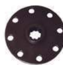
Flange Cubo Embreagem 10 Estrias

Código Original: 82001274 Código Diversa: 1012229