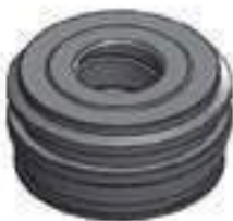
Guia Haste Cilindro Hidráulico Auxiliar

Código Original: 228970 Código Diversa: 1011091