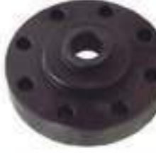
Flange Cubo Volante 20 Estrias

Código Original: E1NNN777AB Código Diversa: 1003867