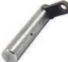
Pino Cilindro de Direção

Código Original: 5198013 Código Diversa: 1012508