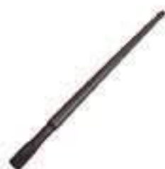
Eixo Árvore Transmissão 06 / 06 Estrias Comprimento: 1020,00mm

Aplicação: Massey Ferguson MF 265 Massey Ferguson MF 275 Massey Ferguson MF 290