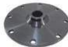
Flange Tomada de Potência (TDP) 15 Estrias

Código Original: 80985700 Código Diversa: 1002374