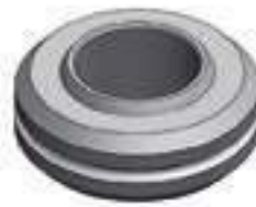
Rótula Braço Hidráulico Diâmetro Int.: 51,00mm