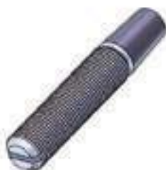
Pino Direção Hidráulica