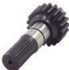
Eixo Acionamento Tração ZF 24 Estrias 19 Dentes