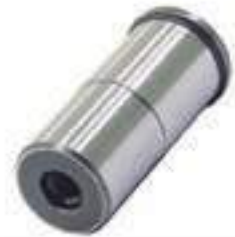
Pino Tração Redutor Comprimento: 73,30mm

Código Original: 5162455 Código Diversa: 1008321