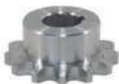
Engrenagem Corrente Eixo Sacas-Palhas e Peneira

Código Original: R305692 Código Diversa: 1012965