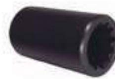
Luva Eixo Árvore 12 Estrias

Código Original: 4997313 Código Diversa: 1008186