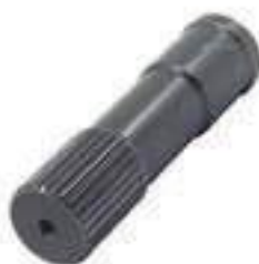
Ponteira Estriada Salva Eixo Eixo Tração ZF 29 Estrias Comprimento: 150mm

Código Original: 053972R1 Código Diversa: 1001309