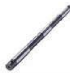
Barra Estabilizadora Braço Hidráulico

Código Original: 5116243 Código Diversa: 1008340