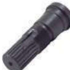
Ponteira Estriada Salva Eixo Pinhão Tração ZF 22 Estrias

Código Original: Código Diversa: 1012940