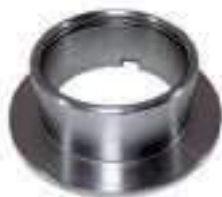
Pista Retentor Roda Traseira