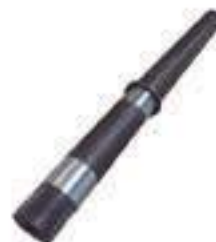
Eixo Traseiro Rodado Duplo

Código Original: CQ27302 Código Diversa: 1008143