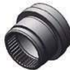
Bucha Eixo Tomada de Potência

Código Original: 036375R1 Código Diversa: 1012766