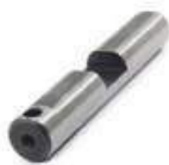
Pino Engrenagem Satélite Tração Dianteira

Código Original: 5124312 Código Diversa: 1008530