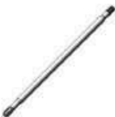
Eixo Árvore Transmissão 06 / 24 Estrias Comprimento: 1020.00mm

Aplicação: Massey Ferguson MF 265 Massey Ferguson MF 275 Massey Ferguson MF 290