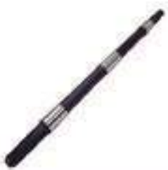
Barra Estabilizadora Braço Hidráulico

Código Original: 5154843 Código Diversa: 1008160