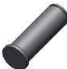
Pino Fixador Cilindro Hidráulico Direção Hidrostática

Código Original: L111959 Código Diversa: 1013237