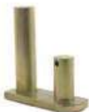
Pino Fixação Braço Inferior

Código Original: 182725M1 Código Diversa: 1010900