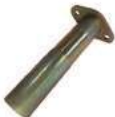
Pino Eixo Dianteiro

Código Original: D5NNN939A Código Diversa: 1002155