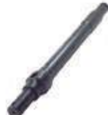
Eixo Sensor Hidráulico

Código Original: R111186 Código Diversa: 1008166