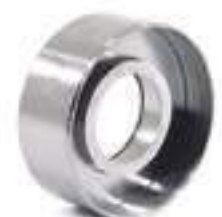
Polia Tensor de Corria Alternador

Código Original: 83961138 Código Diversa: 1010707