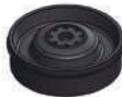
Volante Motor Cummins 6CT 8.3 420X400X120mm