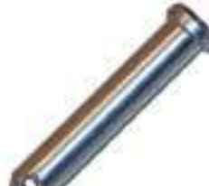
Pino Tração Fixação Barra

Código Original: 3176321M1 Código Diversa: 5004696