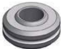
Rótula Braço Hidráulico Diâmetro Int.: 37,50mm