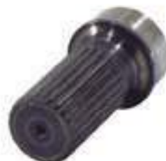
Ponteira Estriada Salva Eixo Cardan 24 Estrias

Código Original: 3113V021 Código Diversa: 1011220