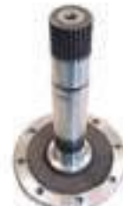
Ponta de Eixo

Código Original: 80591010 Código Diversa: 1010152