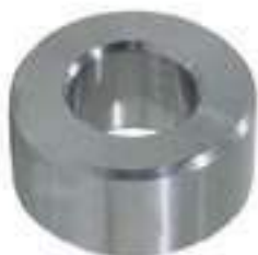
Bucha Guia Parafuso

Código Original: L101813 Código Diversa: 1012833