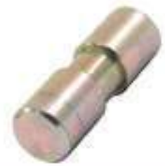
Pino Palanca de Marcha

Código Original: 73919S36 Código Diversa: 1005518