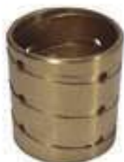
Bucha Bronze Caixa de Câmbio