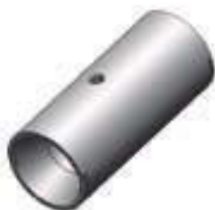
Pino Caixa Satélite Dual Power Transmissão Força Dupla