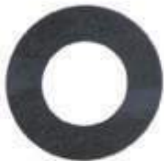
Arruela Eixo Dianteiro

Código Original: 4997200 Código Diversa: 1012168