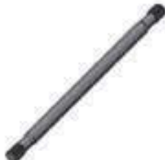
Eixo Transmissão Dianteira Árvore Cardan

Código Original: 5167344 Código Diversa: 1008179