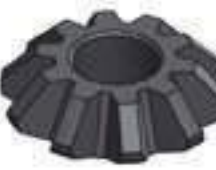
Engrenagem Satélite Redução Roda Traseira 10 Dentes

Código Original: L152490 Código Diversa: 1013020