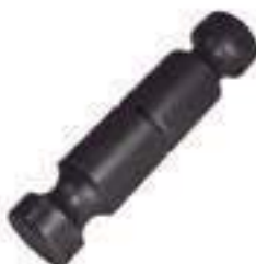
Pino Cilindro Direção

Código Original: 3148787M2 Código Diversa: 1011685