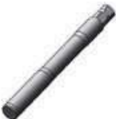
Haste Manga de Eixo Ponta de Eixo Dianteira Lado Direito e Esquerdo

Código Original: D8NN7D082EA Código Diversa: 1004706