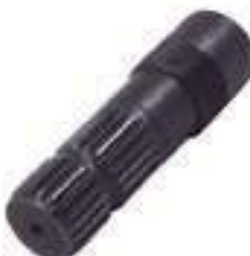
Ponteira Estriada Salva Eixo Pinhão Tração Carraro 21 Estrias

Código Original: Código Diversa: 1010572