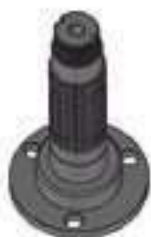
Eixo Tomada de Potência (TDP) Comprimento: 201,00mm 21 Estrias

Código Original: 7400326 Código Diversa: 1010466