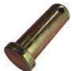
Pino Freio Comprimento: 548mm 28 Estrias

Código Original: 355278S36 Código Diversa: 1010332