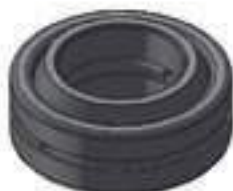
Rótula GE 20 DO Diâmetro Int.: 20,00mm