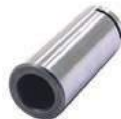
Pino Redutor Lateral Eixo Traseiro

Código Original: 5125861 Código Diversa: 1005516