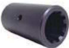
Luva Arraste 10 Estrias

Código Original: 5150124 Código Diversa: 1008132