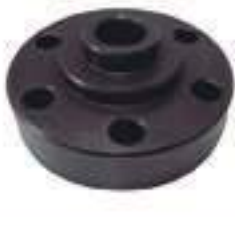
Flange Cubo Tomada de Potência 20 Estrias

Código Original: C5NNN777A Código Diversa: 1003517