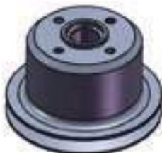
Polia Bomba D'água Motor 4263 Turbo

Código Original: 70670112 Código Diversa: 1005308