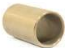
Bucha Bronze Palanca de Marchas

Código Original: 83909592 Código Diversa: 1012264