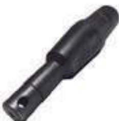
Pino Fixador Sem Sensor Hidráulico

Código Original: L37225 Código Diversa: 1013116