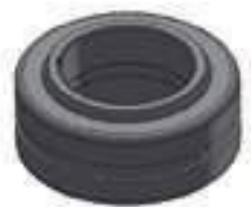
Rótula GE 25 DO Diâmetro Int.: 25,00mm