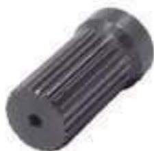
Ponteira Estriada Salva Eixo Pinhão Tração 24 Estrias

Código Original: 6226118/P Código Diversa: 1013816