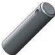
Pino Menor Suporte Tração 28 Estrias

Código Original: COYOTE233 Código Diversa: 1011870