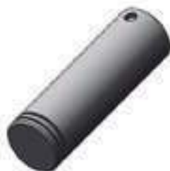
Pino Planetária Comprimento: 144,40mm