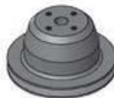
Polia Bomba D'água

Código Original: 31792500 Código Diversa: 1011725