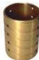
Bucha Bronze Caixa de Câmbio