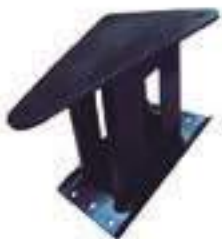
Suporte Adaptador Assento