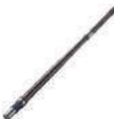
Eixo Tomada de Potência (TDP) Comprimento: 1015,00 22 / 23 Estrias

Aplicação: New Holland TL 65 / 70 New Holland TL 80 / 90