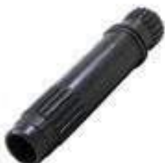
Árvore Primária Comprimento: 223,00mm 20 / 20 Estrias

Código Original: 73400878 Código Diversa: 1012161