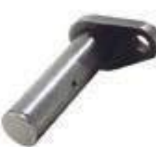
Pino Cilindro de Direção

Código Original: 5171707 Código Diversa: 1012507