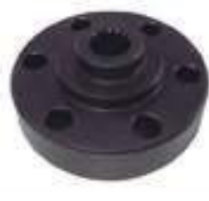
Flange Cubo Tomada de Potência 15 Estrias

Código Original: 87611951 Código Diversa: 1012784