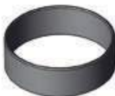
Bucha Aço Eixo Dianteiro Tração Dana

Aplicação: Valmet Série VT Valmet BM 85 / 110 / 120 Valmet 885 / 985