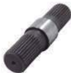
Conjunto Eixo Comando

Código Original: 035680T1 Código Diversa: 1004705