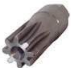
Chave Tocar Volante

Código Original: L156665 Código Diversa: 1013119