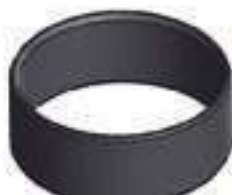
Bucha Aço Eixo Dianteiro Tração Carraro

Aplicação: Valtra BH 140 Valtra BH 160 Valtra BH 180