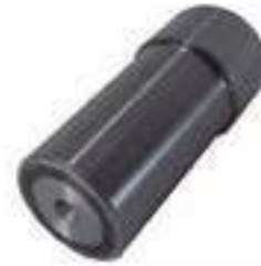
Pino Eixo Dianteiro

Código Original: 4997203 Código Diversa: 1012169