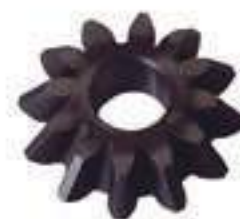
Engrenagem Satélite Diferencial Dianteiro 12 Dentes

Código Original: C5NN4239A Código Diversa: 1013081