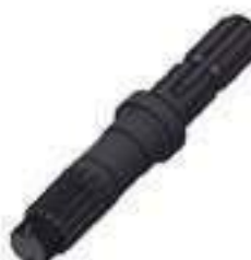
Eixo Tomada de Potência (TDP) Comprimento: 261,50mm 14 / 06 Estrias

Aplicação: Ford 5630 / 6630 / 7630 Ford 7830 / 8030 New Holland TS 100