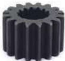
Engrenagem Planetária Eixo Dianteiro 16 Dentes 14 Estrias

Código Original: 4993577 Código Diversa: 1012675