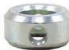
Bucha Cilindro Hidráulico Auxiliar

Código Original: 041082R1 Código Diversa: 1005404