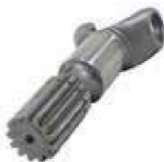
Garfo Lado da Roda Comprimento: 229,50mm 13 Dentes

Código Original: 80985720 Código Diversa: 1012437