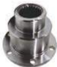
Flange Pinhão Tração 24 Estrias Cód. Alt.: 0095352103

Código Original: 82029100 Código Diversa: 1005643