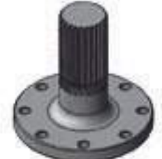
Semi Árvore Traseira Comprimento: 179,20mm 22 Estrias