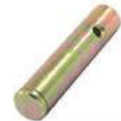
Pino Palanca de Marcha

Código Original: 83955091 Código Diversa: 1012266