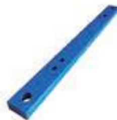
Barra Tração Com Tratamento Térmico

Código Original: 5171100 Código Diversa: 1003870