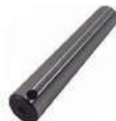
Eixo Satélite Comprimento: 143,50mm

Aplicação: New Holland TL 65 / 70 New Holland TS 90 / 100 New Holland TS 110 / 120