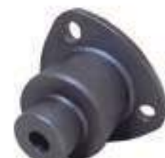
Pivo Flange Eixo Dianteiro

Código Original: 5137239 Código Diversa: 1010947