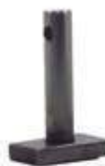
Pino Braço Regulador

Código Original: R105228 Código Diversa: 1013193