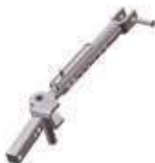
Estabilizador Lado Direito