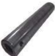
Pino Eixo Dianteiro 2ª Linha

Código Original: 2800731M1 Código Diversa: 1001584