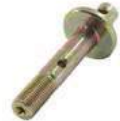
Pino Cabo Acelerador

Código Original: 5165455 Código Diversa: 1012777