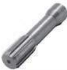
Ponteira Estriada Salva Eixo Eixo Tração ZF 06 Estrias Comprimento: 150mm

Código Original: 909106/P Código Diversa: 1008119