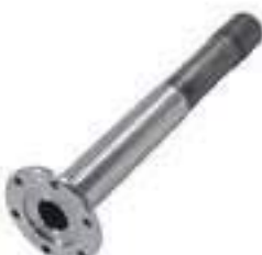
Eixo TDP Embreagem Comprimento: 383,00mm 22 Estrias Oco

Código Original: 30014600 Código Diversa: 1013736