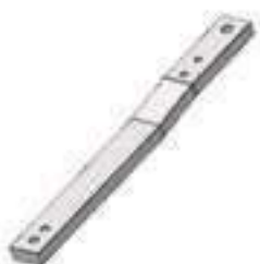
Barra Tração Com Tratamento Térmico

Código Original: 825939 Código Diversa: 1001699