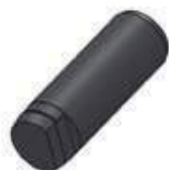
Pino Comprimento: 127,00mm Cód. Alt.: JCB1531

Código Original: 20415302 Código Diversa: 1004569