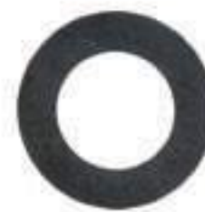
Arruela Calço Tração Dianteira

Código Original: 81816696 Código Diversa: 1011266