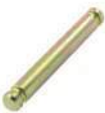
Pino Suporte Barra Tração

Código Original: C5NN3N159A Código Diversa: 1000969