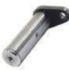
Pino Cilindro de Direção Eixo Dianteiro

Código Original: 5142048 Código Diversa: 1010465