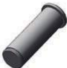
Pino Cilindro de Direção

Código Original: L175586 Código Diversa: 1011892