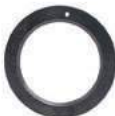
Anel Suporte Eixo Dianteiro

Aplicação: New Holland TM 130 New Holland TM 140