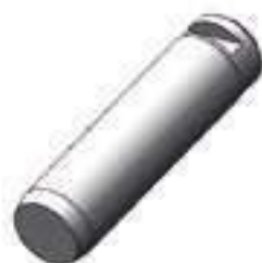
Pino Comprimento: 170,00mm

Código Original: 20410600 Código Diversa: 1004570