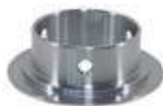
Bucha Tração ZF

Código Original: 3176804M1 Código Diversa: 1001230