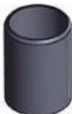
Bucha Tração Garfo ZF

Código Original: CQ29359 Código Diversa: 1010427