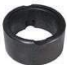
Anel Vedação Eixo Dianteiro Coroa e Pinhão

Código Original: 49936553 Código Diversa: 1012676