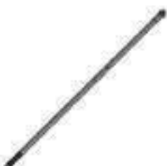
Eixo Tomada de Potência (TDP) Comprimento: 1267,00mm 12 / 10 Estrias

Código Original: 5109726 Código Diversa: 1011835