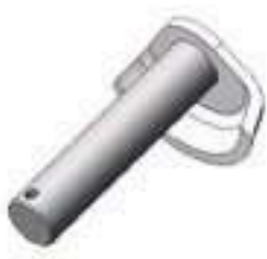
Pino Braço Hidráulico Inferior

Código Original: 487372M1 Código Diversa: 1006325