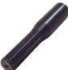
Ponteira Estriada Salva Eixo 22 Estrias

Código Original: 4391483 Código Diversa: 1013719