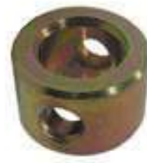
Anel Apoio Haste Motor

Código Original: 84996847 Código Diversa: 1005950