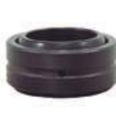
Rótula GE 30 DO Diâmetro Int.: 30,00mm Haste Cilindro Hidráulico Aux.