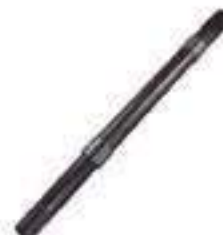
Eixo Acionamento Tração ZF 06 Estrias 19 Dentes