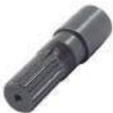
Ponteira Estriada Salva Eixo Pinhão Tração Dana 22 Estrias

Código Original: Código Diversa: 1013073