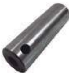
Pino Tração Eixo Traseiro

Código Original: 3410006M1 Código Diversa: 1012864