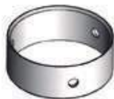
Bucha Mancal Eixo Dianteiro Tração ZF

Código Original: 053956R1 Código Diversa: 1010664