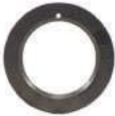
Anel Eixo Tração Dianteira Parte Traseira Arruela Ajuste

Aplicação: New Holland 8030 New Holland 8630 New Holland 8830