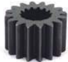
Engrenagem Planetária 16 Dentes 14 Estrias

Código Original: 5137107 Código Diversa: 1010535