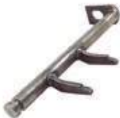
Eixo Alavanca Embreagem Comprimento: 380,00mm

Código Original: 204262 Código Diversa: 1003493