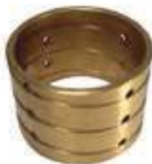
Bucha Bronze Caixa de Câmbio