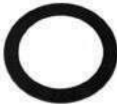
Anel Encosto Diferencial Dianteiro

Código Original: 5116247 Código Diversa: 1013460