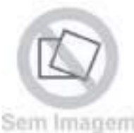
Chapa Protetor Radiador

Código Original: 48174829 Código Diversa: 1013824