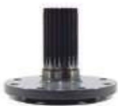
Semi Árvore Freno Em Cima Comprimento: 186,50mm 22 Estrias

Aplicação: Massey Ferguson MF 290 Massey Ferguson MF 297 Massey Ferguson MF 299