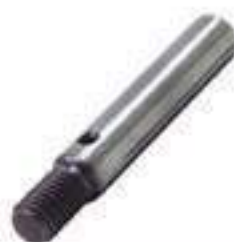
Pino Cilindro Direção

Código Original: 513638M1 Código Diversa: 1001031