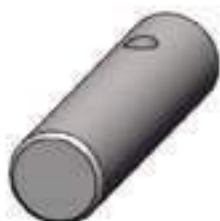
Eixo Garfo Embreagem