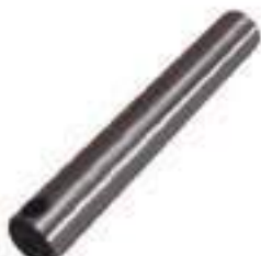
Eixo Satélites Comprimento: 148,00mm

Código Original: 30302210 Código Diversa: 1003638