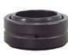
Rótula GE 30 DO Diâmetro Int.: 30,00mm