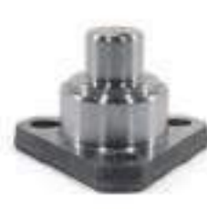
Pino Tração ZF APL 345 / 350 SAE 1020

Código Original: 184631M1 Código Diversa: 1001831