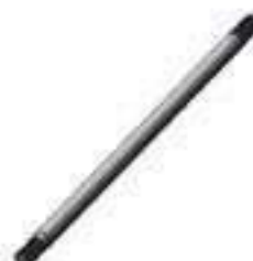
Eixo Tração ZF Comprimento: 696,00mm 22 / 22 Estrias APL 345 / 350