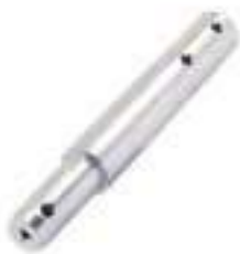
Pino Braço Hidráulico

Código Original: C5NNN932A Código Diversa: 1003579