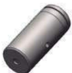
Pino Comprimento: 100,00mm

Código Original: 20410609 Código Diversa: 1004572