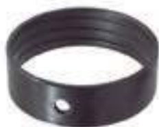
Bucha Aço Eixo Dianteiro Tração Carraro

Aplicação: Valmet Série BM Valmet Série BH Valmet 1280 / 1580 / 1780