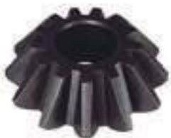
Engrenagem Satélite 13 Dentes

Código Original: 4993578 Código Diversa: 1012674