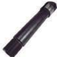
Pistão Tampa Hidráulica

Código Original: 82991159 Código Diversa: 1003855