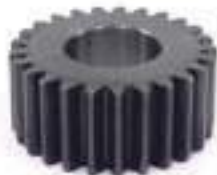
Engrenagem Eixo Traseiro 25 Dentes

Código Original: Código Diversa: 1005716