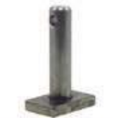
Pino Braço Hidráulico Chapa

Código Original: 5140017 Código Diversa: 1011532