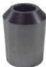
Bucha Aço Cargaça Braço Hidráulico