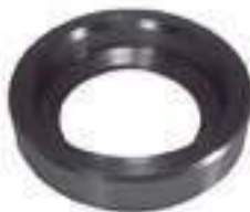
Pista Roda Traseira

Código Original: 241920 Código Diversa: 1004064