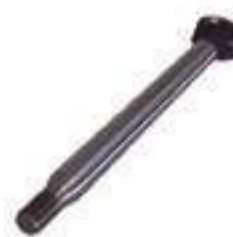
Haste Cilindro de Direção

Código Original: 84996832 Código Diversa: 1008218