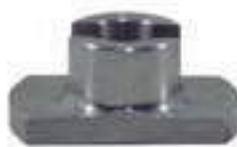
Calço Braço Hidráulico Regulagem Lateral

Código Original: SU45743 Código Diversa: 1013058