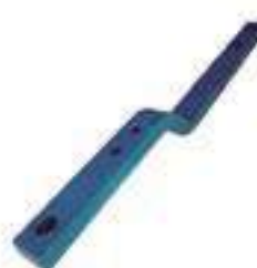
Barra Tração Curva Com Tratamento Térmico

Código Original: 9577788 Código Diversa: 1010842