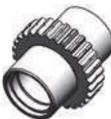
Carretel Caixa Mudança Tomada de Pontência

Código Original: 6210006M1 Código Diversa: 1011383