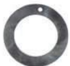
Anel Suporte Eixo Dianteiro Espessura: 05mm (Original)

Código Original: 5136119 Código Diversa: 1008458