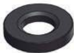
Arruela Motor Perkins 6357