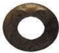
Arruela Encosto Diferencial Dianteiro Latão

Código Original: 5145499 Código Diversa: 1011508