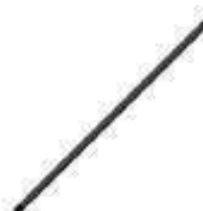
Árvore Transmissão Comprimento: 1755,00mm 12 / 12 Estrias

Código Original: 5168037 Código Diversa: 1011077