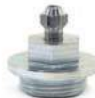
Bujão Válvula Respiro Tampa Hidráulico

Código Original: 84995106 Código Diversa: 1008125