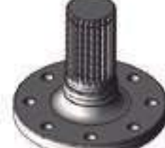
Semi Árvore Traseira Comprimento: 231,50mm 25 Estrias

Aplicação: Massey Ferguson 660 Massey Ferguson 680