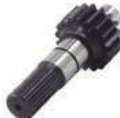
Eixo Acionamento Tração ZF 24 Estrias 18 Dentes