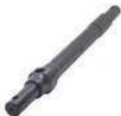
Eixo Sensor Hidráulico

Aplicação: John Deere 6165J John Deere 6180J