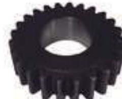
Engrenagem Satélite 24 Dentes

Código Original: 5108747 Código Diversa: 1010534