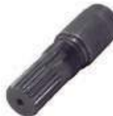
Ponteira Estriada Salva Eixo Pinhão Tração Dana 22 Estrias

Código Original: Código Diversa: 1008420