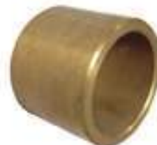
Bucha Bronze Redução

Código Original: C7NN7506D Código Diversa: 1003201