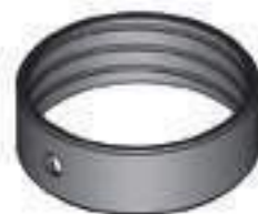
Bucha Aço Eixo Dianteiro Tração Carraro Cód. Alt.: CAR 126632

Aplicação: Valtra BH 140 Valtra BH 160 Valtra BH 180