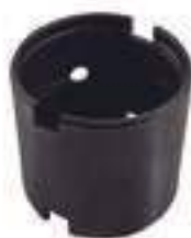
Bucha Pino Central Eixo Dianteiro

Código Original: L173129 Código Diversa: 1011894