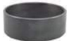
Bucha Tração Carraro

Código Original: 3603213M1 Código Diversa: 1000838