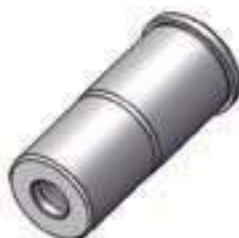
Pino Eixo Tração Dianteira

Código Original: 5140170 Código Diversa: 1012506