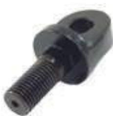
Pino Braço Hidráulico Engate

Código Original: 5181053 Código Diversa: 1013171