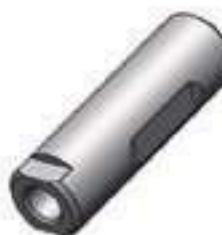
Pino Fixador Transmissão Diferencial

Código Original: L111957 Código Diversa: 1013235