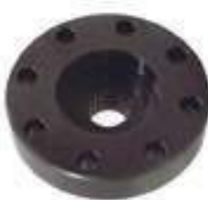
Flange Cubo Embreagem 22 Estrias

Código Original: 87389438 Código Diversa: 1011254