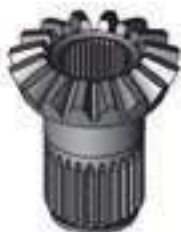
Engrenagem Planetária Esquerda Redução Traseira 16 Dentes 27 / 38 Estrias

Código Original: C5NN4236A Código Diversa: 1013080