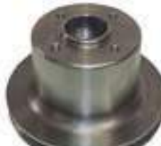
Polia Bomba D'água Motor Perkins

Código Original: 376398M1 Código Diversa: 1001832