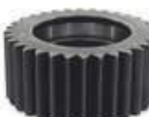
Engrenagem Planetária Rodado Duplo 32 Dentes

Código Original: R134963 Código Diversa: 1013220