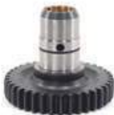
Engrenagem Caixa de Transferência 38 Dentes Bucha Bronze

Código Original: 5125065 Código Diversa: 1012166