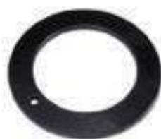
Anel Carcaça Eixo Dianteiro

Aplicação: New Holland TM 130 New Holland TM 140