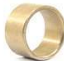
Bucha Bronze Caixa de Câmbio

Código Original: 5136120 Código Diversa: 1008354