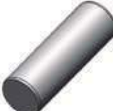
Pino Carcaça Tração

Código Original: C7NN807D Código Diversa: 1003503