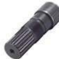
Ponteira Estriada Salva Eixo Pinhão Tração Dana 22 Estrias

Código Original: Código Diversa: 1008393