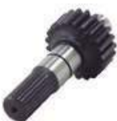
Eixo Mancal Traseiro Tração ZF APL 356/359 29 Estrias 24 Dentes