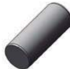
Pino Carcaça Eixo Dianteiro

Código Original: E6NN3N160AA Código Diversa: 1002313