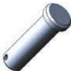
Pino Inferior Estabilizador Vertical