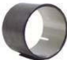
Bucha Aço Tração

Código Original: 5136116 Código Diversa: 1008456