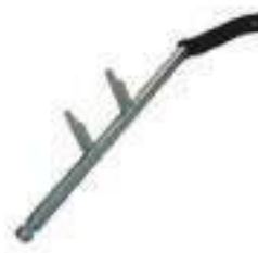
Eixo Alavanca Embreagem Comprimento: 400,00mm

Código Original: 81857300 Código Diversa: 1012973