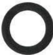
Arruela Freio de Mão

Código Original: 4998022 Código Diversa: 1010054