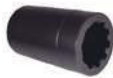
Luva Arraste 10 Estrias

Código Original: 73401606 Código Diversa: 1010576