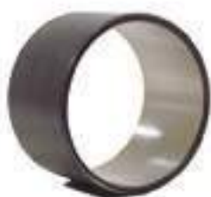
Bucha Aço Tração