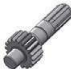
Eixo Acionamento Tração ZF 06 Estrias 18 Dentes

Código Original: 3603221M1 Código Diversa: 1003860