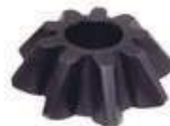
Engrenagem Pinhão Eixo Traseiro 09 Dentes

Código Original: E9NN7Z115CB Código Diversa: 1012878