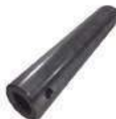
Pino Eixo Dianteiro

Código Original: 1482934M92 Código Diversa: 1003665