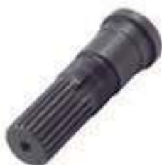
Ponteira Estriada Salva Eixo Pinhão Tração 22 Estrias

Código Original: Código Diversa: 1012002