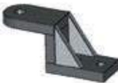
Suporte Barra Tração

Código Original: COYOTE232 Código Diversa: 1011863