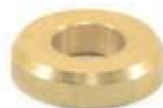
Bucha Bronze Encosto Eixo Hidráulico

Aplicação: Valmet VT 62 / 65 / 68 Valmet VT 78 Valmet VT 85 / 86 / 88