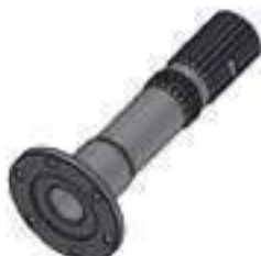
Eixo Multitorque Comprimento: 226,50mm 22 Estrias Oco

Código Original: 440530 Código Diversa: 1010291