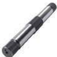
Eixo Sistema Hidráulico Comprimento: 563,00mm

Aplicação: Ford 5600 / 6600 Ford 5610 / 6610 / 7610