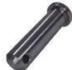
Pino Estabilizador Telescópico

Código Original: 9575981 Código Diversa: 1010092