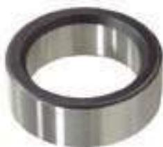
Espaçador Pista do Retentor Espessura: 21,60mm