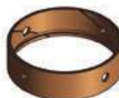
Bucha Bronze Mancal Dianteiro