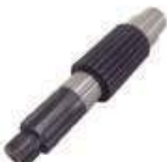
Eixo Saída Caixa de Câmbio Comprimento: 230,00mm 6 / 24 Estrias Cód. Alt.: 11401437

Código Original: 165810 Código Diversa: 1002780