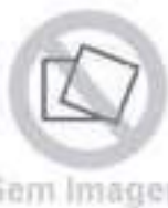
Kit Adaptação motor MWM

Código Original: 5176122 Código Diversa: 1008162