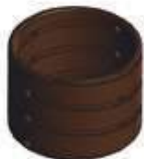
Bucha Bronze Caixa de Câmbio