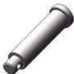
Pino Cilindro Hidráulico Auxiliar

Aplicação: Massey Ferguson MF 290 Massey Ferguson MF 292 Massey Ferguson MF 295