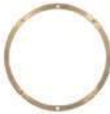
Anel Tração APL 352 Bronze

Código Original: 5141457 Código Diversa: 1010379