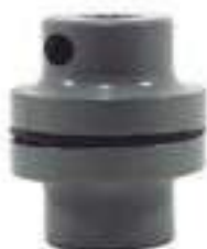
Conjunto Acoplamento Bomba Hidráulica

Código Original: 350355X1 Código Diversa: 1001012