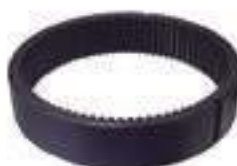
Coroa Redução Final Coroa da Carcaça

Código Original: OTCJD83 Código Diversa: 1011250