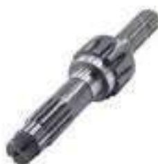
Eixo Tomada de Potência (TDP) Comprimento: 327,50mm 14 / 06 Estrias 12 Dentes