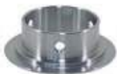
Bucha Tração Eixo Dianteiro

Aplicação: John Deere 5600 John Deere 5700