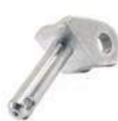
Pino Garfo Estabilizador

Código Original: 76240S36 Código Diversa: 1003580