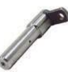
Pino Cilindro de Direção

Código Original: 48174834 Código Diversa: 1013823