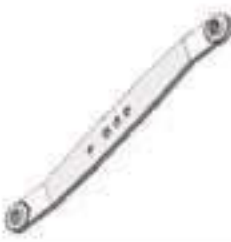
Braço Levante Hidráulico

Código Original: 84996584 Código Diversa: 1008120