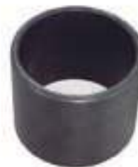
Bucha Tração Garfo Dana

Código Original: APL359 Código Diversa: 1005548