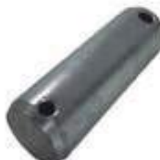
Pino Barra Tração