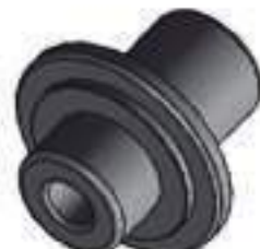
Pino Central Eixo Dianteiro

Código Original: L172534 Código Diversa: 1011893