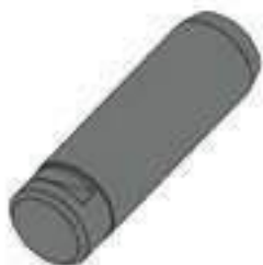
Pino Comprimento: 145,00mm

Código Original: 2040110075 Código Diversa: 1003765