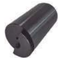
Pino Eixo Satélite

Código Original: C5NNN823D Código Diversa: 1012326