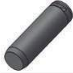
Pino Comprimento: 200,00mm