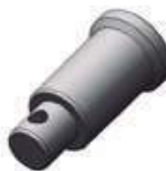
Pino Cilindro Hidráulico Auxiliar

Código Original: 898363M1 Código Diversa: 5001032