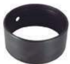
Bucha Tração Eixo Dianteiro Dana

Código Original: SU45733 Código Diversa: 1013057