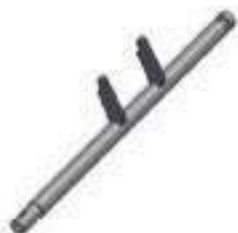
Eixo Alavanca Embreagem Comprimento: 443,00mm