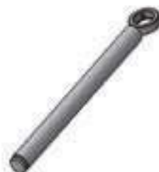
Haste Cilindro Hidráulico Auxiliar Comp. Haste: 359,00mm

Código Original: 80741500 Código Diversa: 1010685