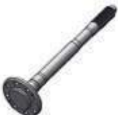
Semi Árvore Traseira Comprimento: 631,00mm 39 Estrias