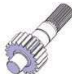
Eixo Acionamento Tração ZF 24 Estrias 21 Dentes

Código Original: 3603219M1 Código Diversa: 1010244