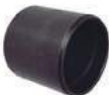
Bucha Aço Inferior Ponta de Eixo

Código Original: 84996852 Código Diversa: 1004722