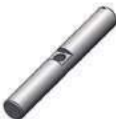
Pino Fixador Transmissão Diferencial

Código Original: L111958 Código Diversa: 1013236