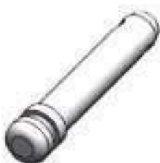
Pino Terceiro Ponto

Código Original: 2800731M1 Código Diversa: 5001584