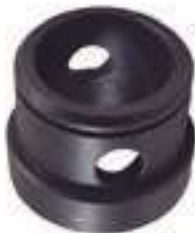
Bucha Braço Hidráulico

Código Original: L207630 Código Diversa: 1013497