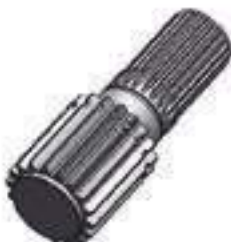
Eixo Tração Eixo Dianteiro

Código Original: L15676 Código Diversa: 1010710