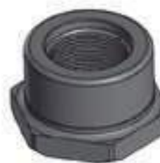
Porca Eixo Dianteiro

Código Original: Código Diversa: 1011882