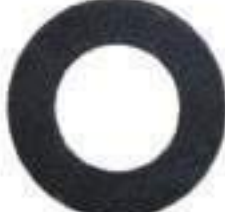
Arruela Plana Eixo Dianteiro

Código Original: 4993654 Código Diversa: 1012677