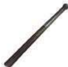
Eixo Roscado Comprimento: 426,00mm 15 Estrias

Código Original: 157380 Código Diversa: 1002779