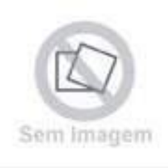
Pino Sistema Hidráulico

Código Original: 871920 Código Diversa: 1010802