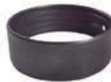
Bucha Tração Eixo Dianteiro Dana

Código Original: L77331 Código Diversa: 1013120