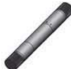
Eixo Sistema Hidráulico Comprimento: 465,00mm 30 / 30 Estrias

Código Original: 822340 Código Diversa: 1012262