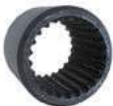
Luva Adaptar Bomba 24 Estrias