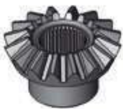
Engrenagem Planetária Direita Redução Traseira 16 Dentes 38 Estrias

Código Original: 5145501 Código Diversa: 1008396