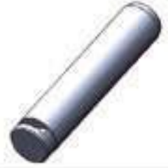
Pino Comprimento: 280,00mm

Código Original: 871940 Código Diversa: 1010803