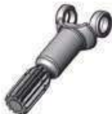
Garfo Lado da Roda Comprimento: 245,50mm 13 Dentes

Código Original: 81915900 Código Diversa: 1011040