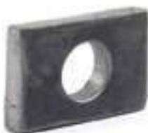
Chapa Guia Pino Braço Hidráulico

Código Original: 81802102 Código Diversa: 1011528