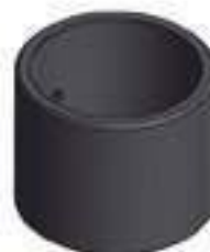
Bucha Aço Caixa de Câmbio

Aplicação: Valmet VT 685C / 685F Valmet VT 785C / 785F Valmet BF 65 / 75