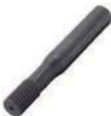
Ponteira Estriada Salva Eixo Eixo Tração ZF 24 Estrias Comprimento: 260mm

Código Original: 036295/P Código Diversa: 1012116