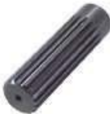
Ponteira Estriada Salva Eixo Caixa de Transferência 17 Estrias

Código Original: L158186 Código Diversa: 1013118