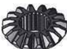
Engrenagem Planetária Redução Roda Traseira 16 Dentes 24 Estrias

Código Original: CQ05889 Código Diversa: 1012832