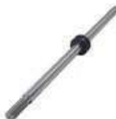
Haste Cilindro de Direção Hidrostática

Código Original: 82991197 Código Diversa: 1008205