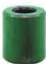
Bucha Apoio Suporte Barra Tração

Código Original: L175588 Código Diversa: 1011895