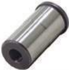
Pino Tração Redutor Comprimento: 63,30mm

Código Original: 5162172 Código Diversa: 1011290