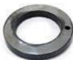
Anel Suporte Eixo Dianteiro Espessura: 10mm

Código Original: 5140456 Código Diversa: 1012222