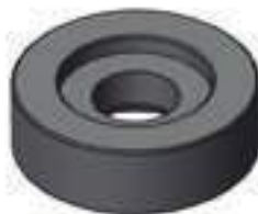
Arruela Parafuso Roda Traseira