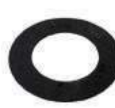
Anel Espaçador Engrenagem Eixo Traseiro 28 Estrias

Código Original: 5142026 Código Diversa: 1010426