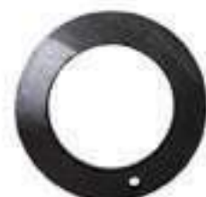
Anel Suporte Eixo Dianteiro Espessura: 06mm

Aplicação: New Holland TL 65/70/80 New Holland TM 110/120