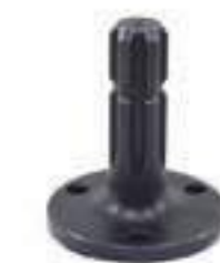
Eixo Tomada de Potência (TDP) Comprimento: 128,00mm 06 Estrias

Aplicação: New Holland TM 135 / 150 New Holland TM 165 / 180