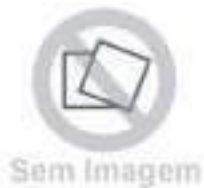
Arruela Motor Perkins