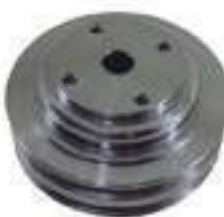
Polia Bomba D'água

Código Original: 87333763 Código Diversa: 1013042