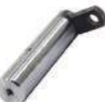
Pino Cilindro de Direção Eixo Dianteiro

Código Original: 5173252 Código Diversa: 1010464