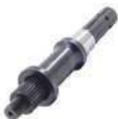
Eixo Tomada de Potência (TDP) Comprimento: 308,00mm 26 / 06 Estrias

Código Original: 5185602 Código Diversa: 1011412