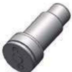
Pino Eixo Planetário Comprimento: 144,50mm Cód. Alt.: 742200

Código Original: 20415311 Código Diversa: 1003868