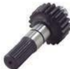
Eixo Acionamento Tração ZF 24 Estrias 21 Dentes