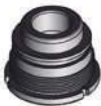
Guia Haste Direita

Código Original: 30344710 Código Diversa: 1001654