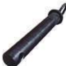
Pino Barra Tração Comprimento: 170mm Espessura: 25,40mm

Código Original: 033991P1 Código Diversa: 1011975