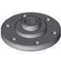
Flange Cubo / Adaptador Tomada de Potência Motor MWM 6 Cilindros

Código Original: 87390059 Código Diversa: 1011512