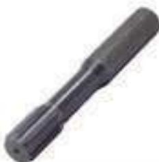
Ponteira Estriada Salva Eixo Eixo Tração ZF 06 Estrias Comprimento: 260mm

Código Original: 3409609/P Código Diversa: 5001367