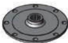
Flange Tomada de Potência (TDP) 15 Estrias Cód. Alt.: 30021810

Código Original: 81228300 Código Diversa: 1013174