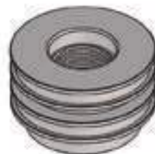
Pistão Embolo Cilindro Hidráulico Auxiliar

Código Original: 30174000 Código Diversa: 1001784