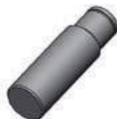
Eixo Tração ZF Importada

Código Original: 3148175M2 Código Diversa: 1003811