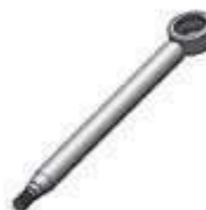
Haste Cilindro de Direção

Código Original: 82991193 Código Diversa: 1005468