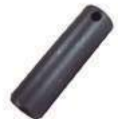
Pino Barra Tração

Código Original: C7NN2N332A Código Diversa: 1005004