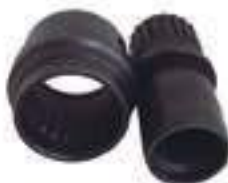
Eixo Luva Grupo Tração ZF Sem Duo Power Ano Abaixo de 1984

Aplicação: Ford 5600 / 6600 Ford 5610 / 6610 / 7610