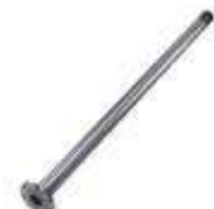
Eixo Multitorque Comprimento: 1002,00mm 22 Estrias Oco

Código Original: 80812900 Código Diversa: 1011247