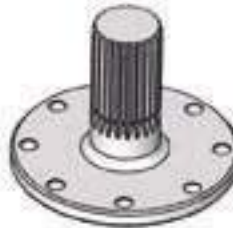
Semi Árvore Traseira Anel Embaixo Comprimento: 189,00mm 22 Estrias

Aplicação: Massey Ferguson MF 290 Massey Ferguson MF 292 Massey Ferguson MF 295