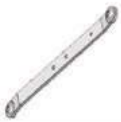
Braço Levante Hidráulico

Código Original: 82980723 Código Diversa: 1011102