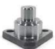
Pino Tração ZF APL 345 / 350 Blank 94

Código Original: 3176321M1 Código Diversa: 1004696