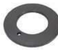
Anel Eixo Tração Dianteira Parte Dianteira Arruela Ajuste

Aplicação: New Holland TM 140 New Holland TM 140