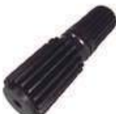
Eixo Solar Tração ZF APL 335

Código Original: 871180 Código Diversa: 1013620