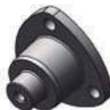
Pivo Flange Eixo Dianteiro

Código Original: 83955147 Código Diversa: 1012268