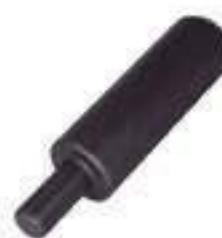
Pino Fixador Regulador Barra Tração

Código Original: L36085 Código Diversa: 1011774