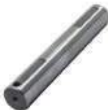
Pino Satélite Diferencial Dianteiro

Código Original: C7NN4048E Código Diversa: 1001689