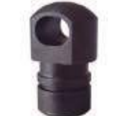
Garfo Articulador Pistão do Hidráulico

Código Original: Código Diversa: 1012322