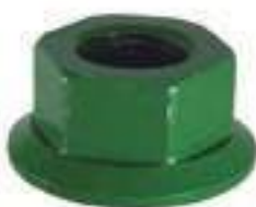
Porca Flangeada Acionamento Eixo Sem Fim Transportador

Código Original: CQ29317 Código Diversa: 1011378