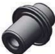
Pino Central Eixo Dianteiro

Código Original: L111817 Código Diversa: 1004941